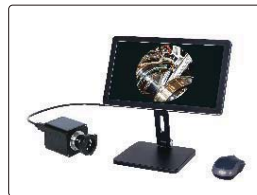
相机和显示器(选配)